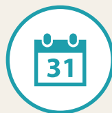
イベント申込みフォーム