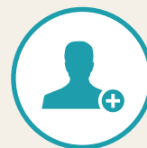
会員登録フォーム