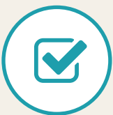
アンケートフォーム