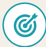
キャンペーン応募フォーム