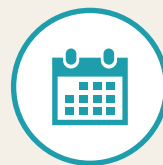
期間限定応募フォーム