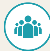
数量限定応募フォーム