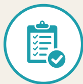
ヒアリングフォーム