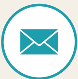
お問い合わせフォーム