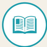
資料請求フォーム