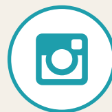
写真投稿フォーム